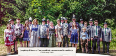
Jungkönig, Kaiser und Gaujungenkönig zusammen mit Ihrem Gefolge (Freilobhof 2018)