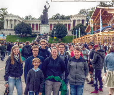
Die Rathausknechtin auf dem Oktoberfest Alte von 1916 bis die weiß-blauen Plinthe! (München 2017)